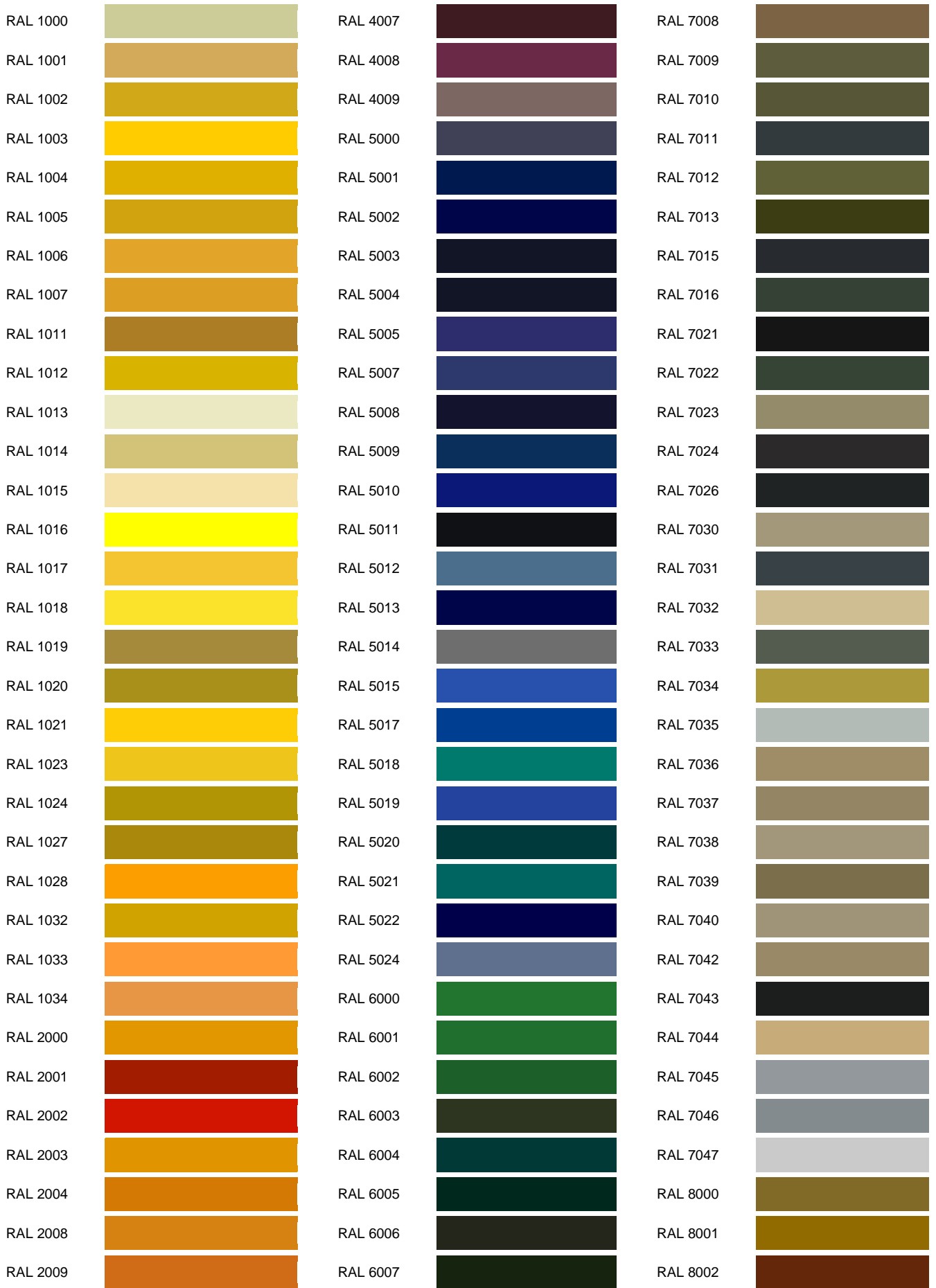
Tabla de colores RAL